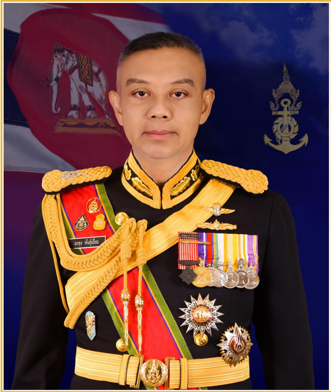
พลเรือเอก อะดุง พันธุ์เอี่ยม ผู้บัญชาการทหารเรือ